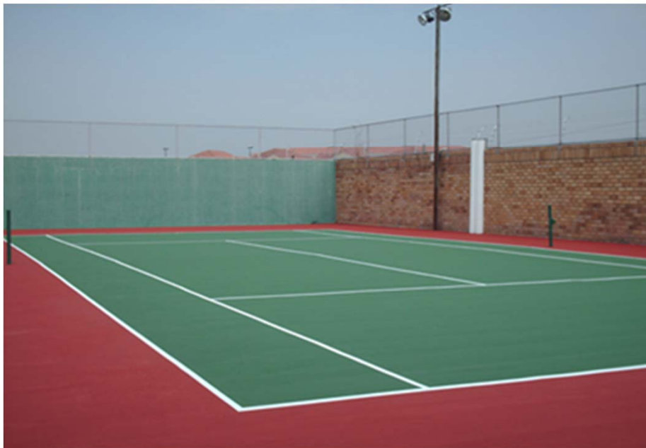
PRIVADA – VIA SAMBORONDON