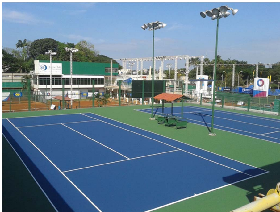
GUAYAQUIL TENIS CLUB