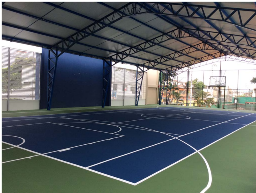
GUAYAQUIL TENIS CLUB