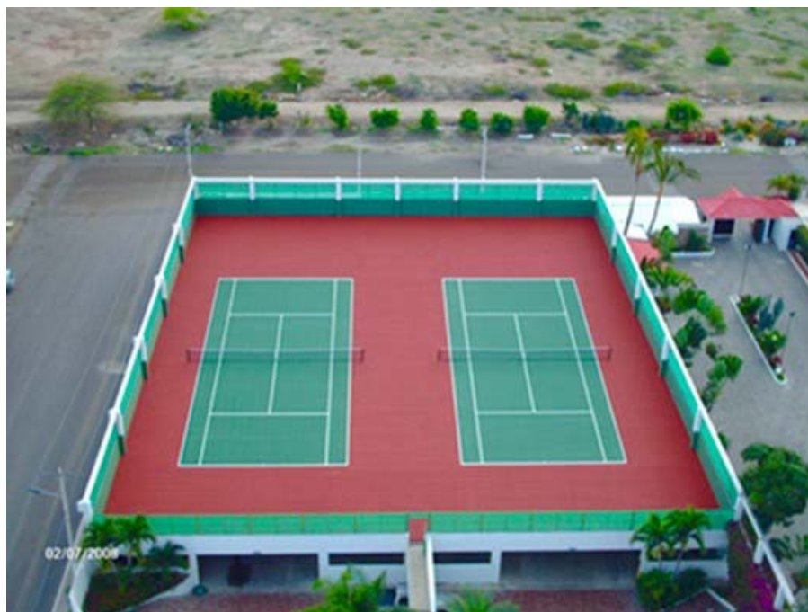
PRIVADAS – SALINAS-LOSA DE ESTACIONAMIENTO