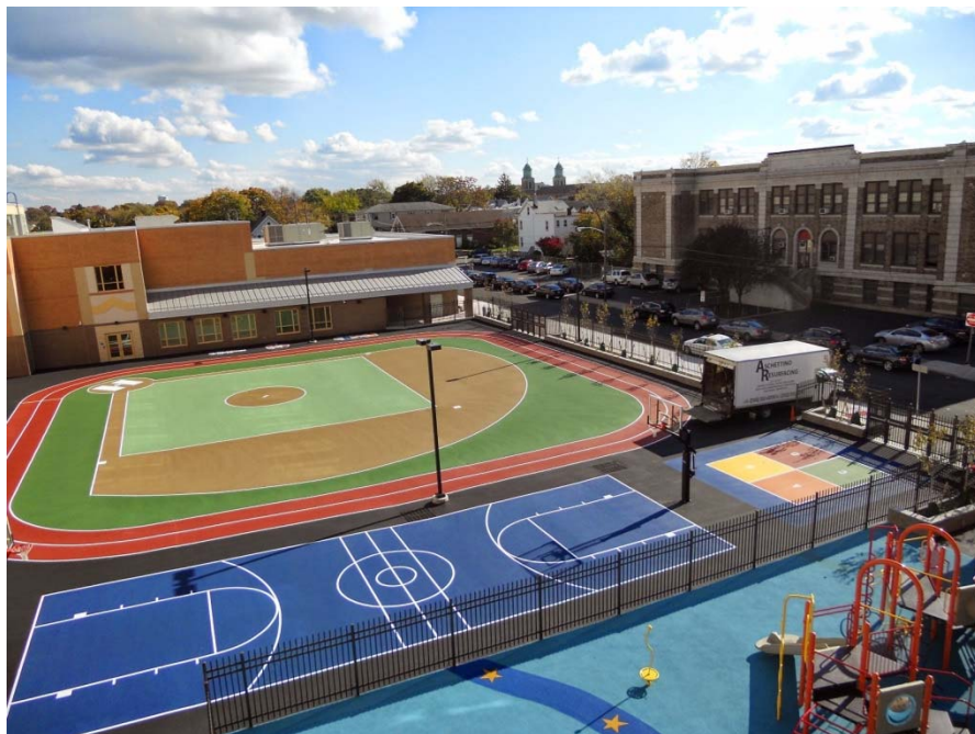
EDUCATIVO - USA