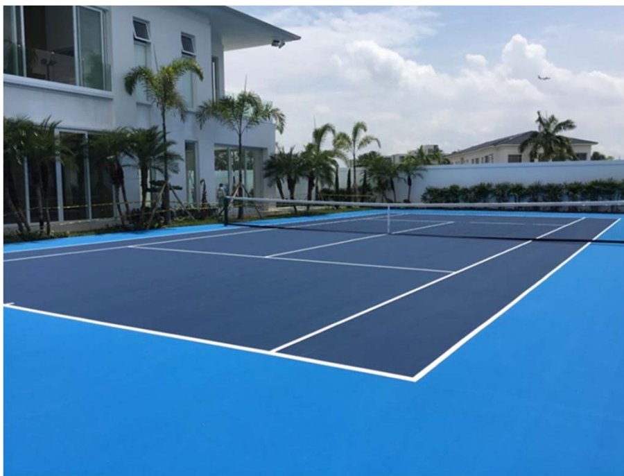
PRIVADA – SISTEMA CUSHION PREFABRICADO