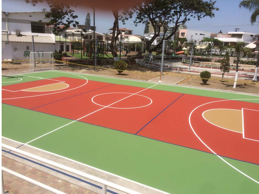
CANCHA MULTIPLE – PARQUE CENTRAL CDLA. ENTRERIOS