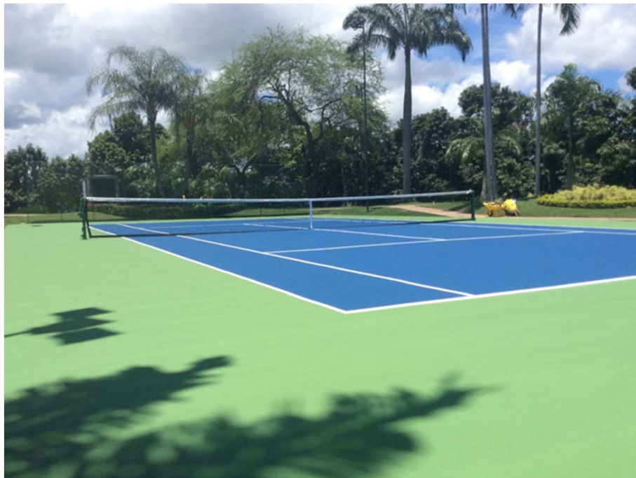
PRIVADA – VIA A LA COSTA