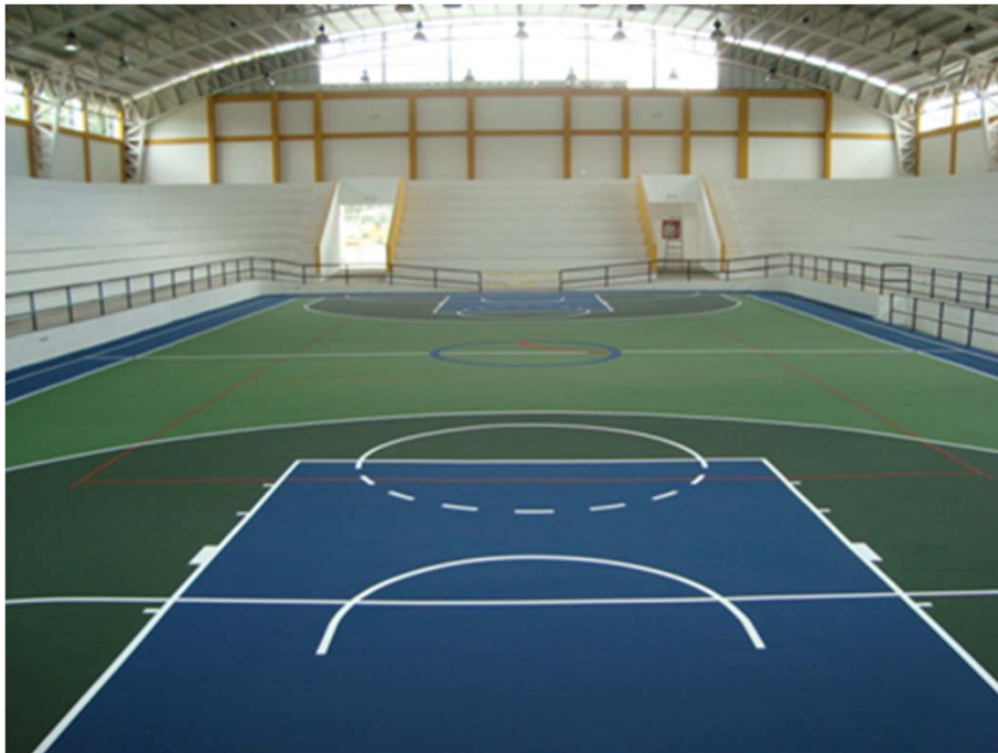
COLISEO - TUMBACO