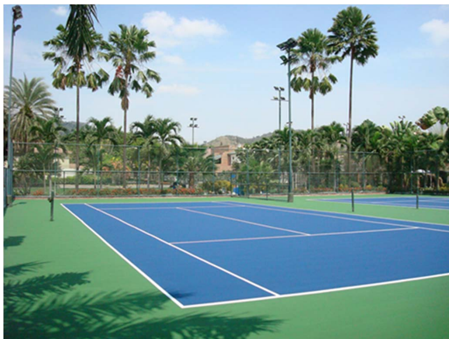
PRIVADA – VIA A LA COSTA